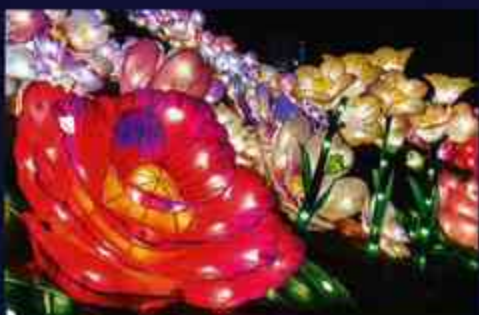
3 世界最大級面積「ランタン花畑」は、時空を超えた場所へと通じる異空間？