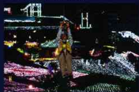
5 日本初イルミ上空に架かる「ジップライン〜Julie〜」往復になってドキドキ倍増？