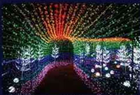
1 「夢のトンネル」インスタ映えNo.1。ここを抜けると、さらなる夢の世界。

「光と音のショー」トンネルを抜けた area では数分に一回光と音のショーを開催。楽しい曲に合わせて、お菓子も海の仲間も花も踊り出す？展望台や架け橋など、見る場所が変わると違った景色に見えるかも？