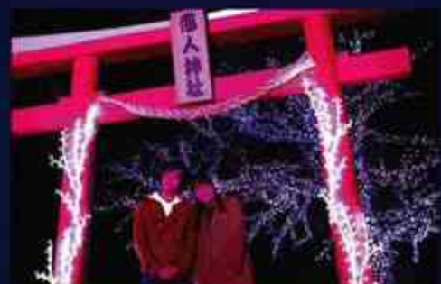
7 「恋人神社」昨年途中から登場した「恋人神社」。ここで結ばれたカップルの子供は勿論キラキラネーム？