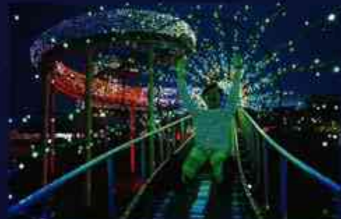
6 日本初グランイルミ名物のロングライダー「ナイトレインボー」。歓声の途切れないナュー楽しいスライダー。君は何回滑った？