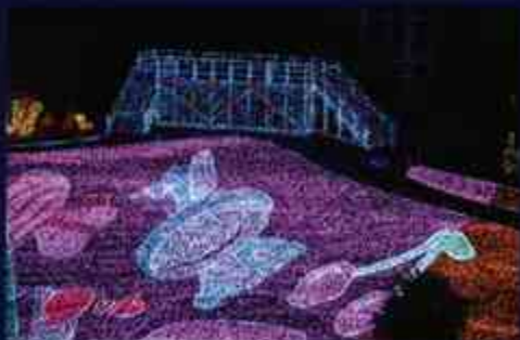
2 「ウキウキへの架け橋」見晴らし抜群な橋。

「フルカラーレーザーショー」超カラフルなレーザー光を照射することにより、まるでオーロラが躍動しているかのような光景を創り出す幻想的なショー。光と音楽に包まれる感覚を楽しむことができます。またスモークは風の影を寄せやすく常に移ろうため、万華鏡のように再び同じ光景に巡り合うことがなく、その時々々のベストポジション<<ベストポジション>>を探求するのもこのショーの醍醐味の一つです。