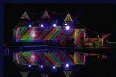
4 ナューカラフル「海城館と水の広場」体験型乗り物がいっぱいある area。